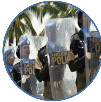
وحدات شرطة مُكونة