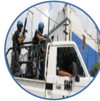
فرق شرطة متخصصة