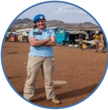
أفراد الشرطة المقدمين من الحكومات